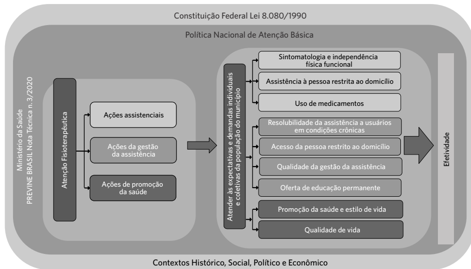
Figura 2. Modelo teórico-lógico para avaliar efetividade da atuação fisioterapêutica na atenção básica